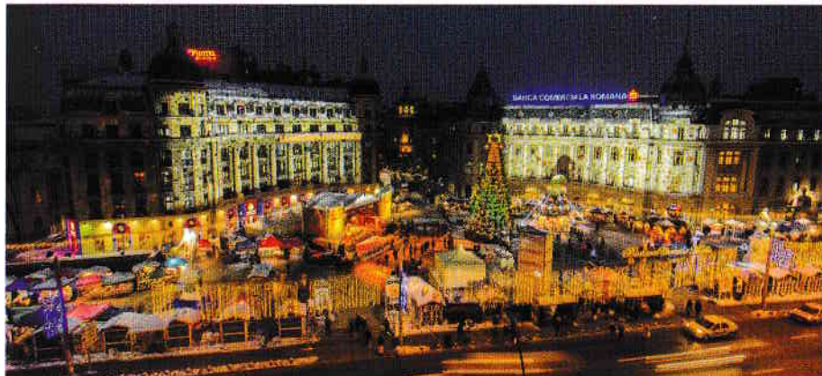
Esplanada La Statui din Piața Universității este scenă pentru târguri și festivaluri urbane. The Statues Esplanade of Piața Universității is an open-air venue for fairs and urban festivals.