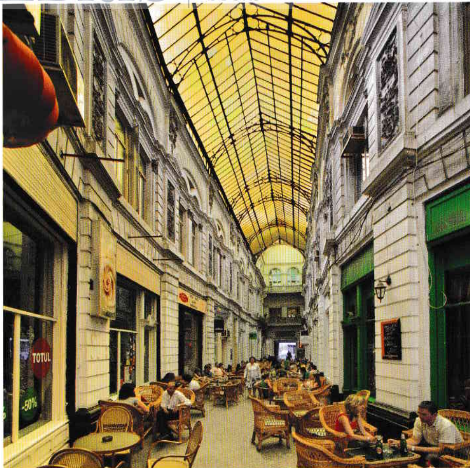
Pasajul comercial Macca-Villacrosse (1891) / The Macca-Villacrosse Arcade (1891)