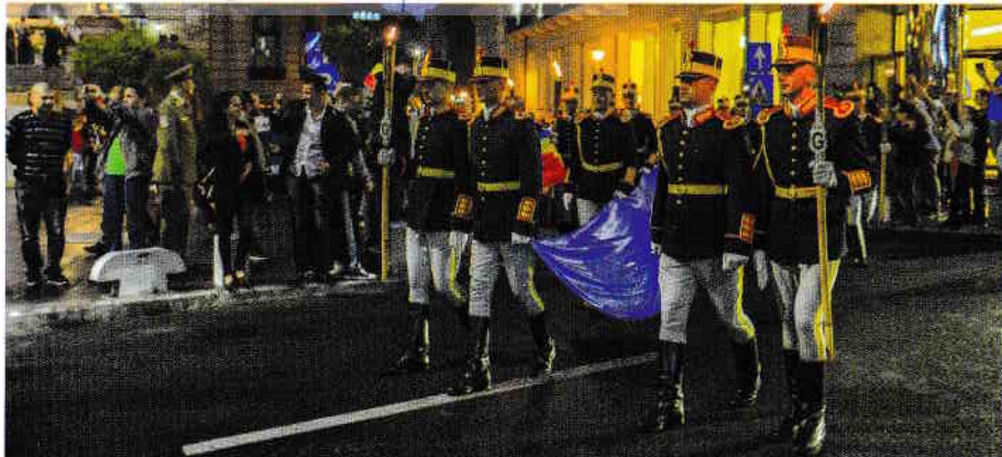
Paradă de Ziua Drapelului Național (26 iunie) National Flag Day parade, 26 June